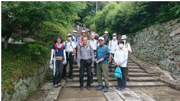
矢田寺の長い長い石段を登る前にパチリ

降雨確率 90%を強行実施した月例研修会!!なのに雨降らず?? 暑くなく寒くなく、雨を避けてか人出も少なく絶好のアジサイ観賞日和に(*^_^*) 23人→13人の参加