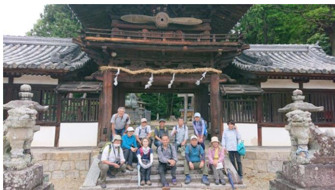
楼門に「航空祖神」の扁額と中島飛行機製の「陸軍九一戦闘機」の木製プロペラが掲げられている