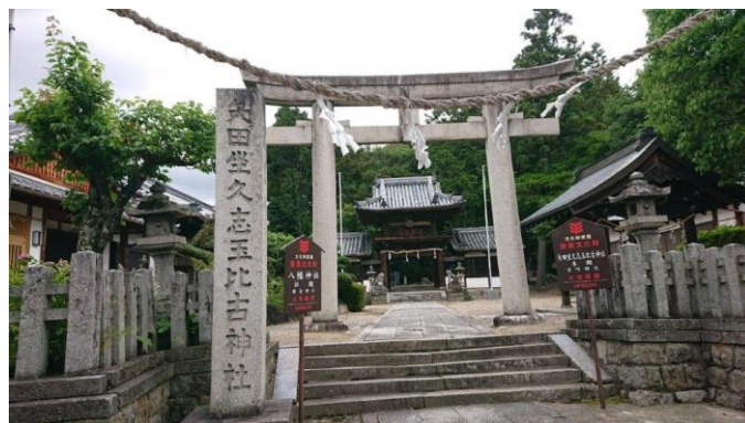
矢田坐久志玉比古神社：古代の豪族である物部氏の祖神といわれる饒速日命（にぎはやひのみこと）が祀られている。天孫降臨の際、天磐船から三本の矢を射て、その落ちた所を宮居にしたという伝説が伝わっている