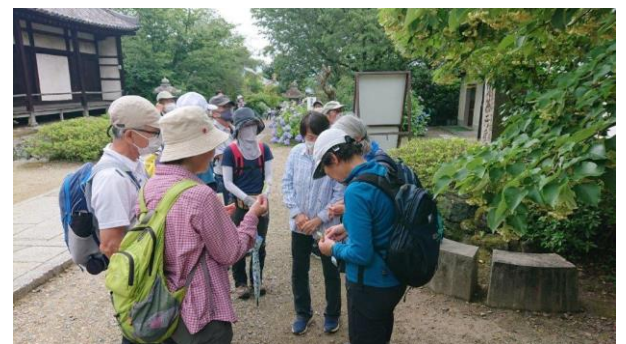
菩提樹の観察中 (釈迦が木の下で悟りを開いたとされるインドボダイジュは日本にはない)