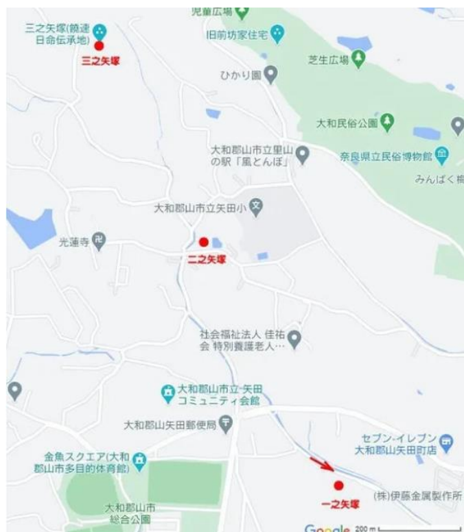
近くに一ノ矢塚、三之矢塚がありますので歴史に興味のある方は探してみてください。ちょっと分かりにくいかもしれませんが・・・見つけると感動かも??