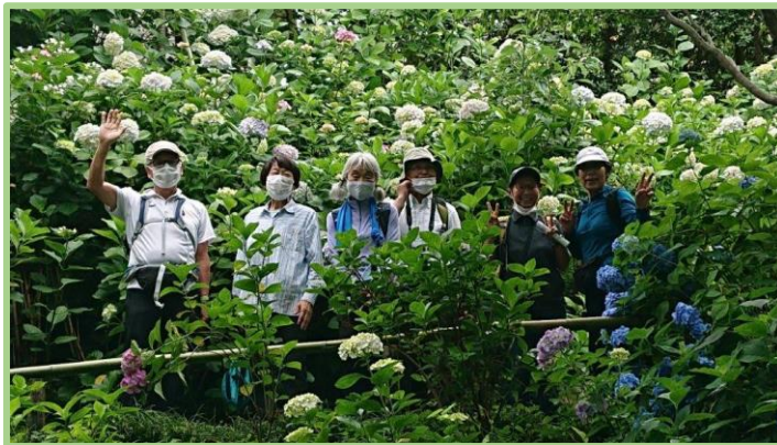
霧雨に濡れて生き生きとしたアジサイに囲まれて