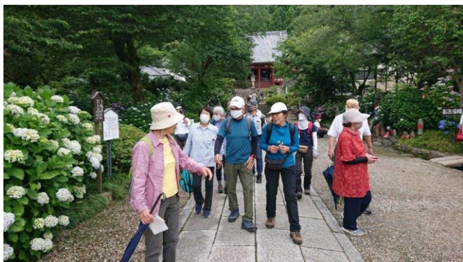
長い傘が邪魔なくらい雨降らず。さあ次は矢田坐久志玉比古神社まで歩きましょう！