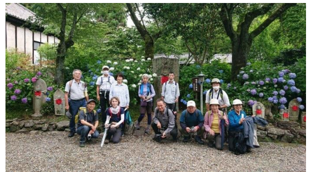
有名な味噌なめ地藏の前で

降雨確率 90%を強行実施した月例研修会!!なのに雨降らず?? 暑くなく寒くなく、雨を避けてか人出も少なく絶好のアジサイ観賞日和に(*^_^*) 23人→13人の参加