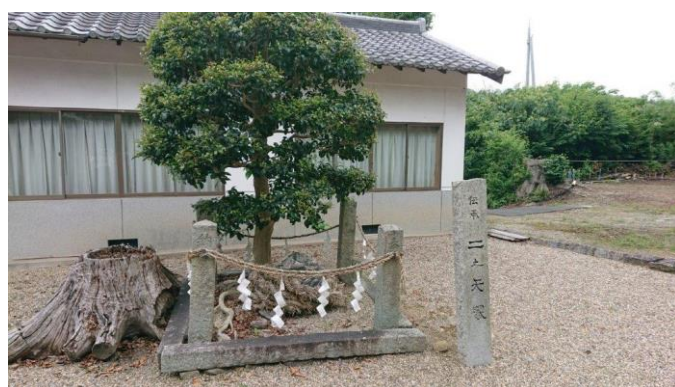
二の矢塚：2本目の矢が落ちた場所とされている