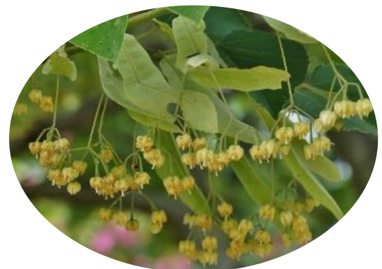
満開のかわいい菩提樹の花