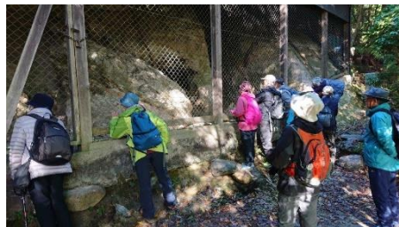
春日山石窟仏を覗き込む