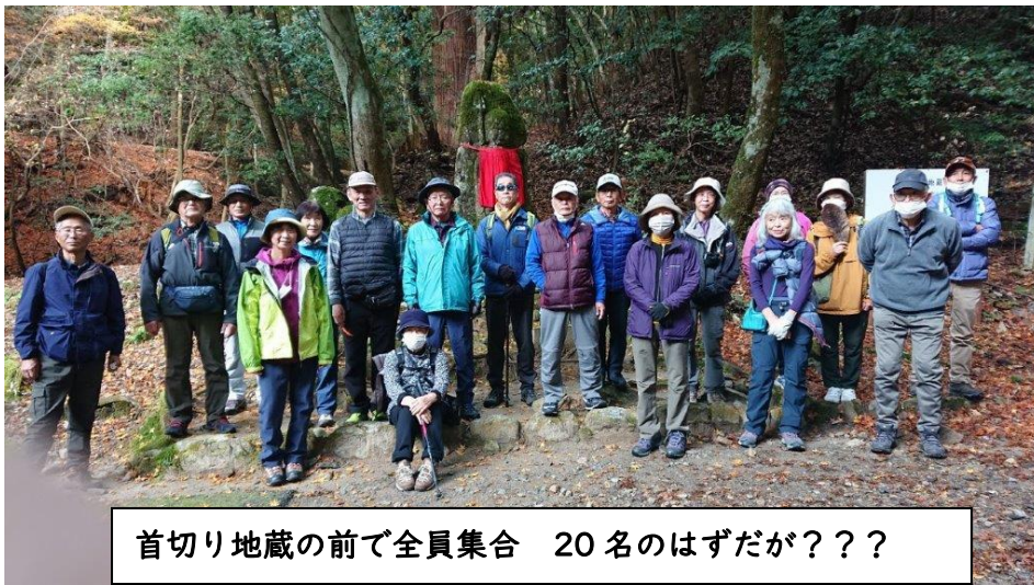
首切り地蔵の前で全員集合 20名のはずだが???