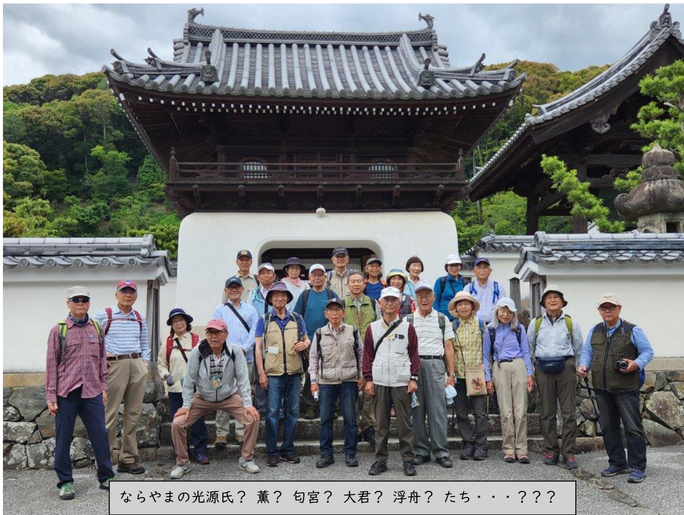
ならやまの光源氏？ 薫？ 匂宮？ 大君？ 浮舟？ たち・・・???