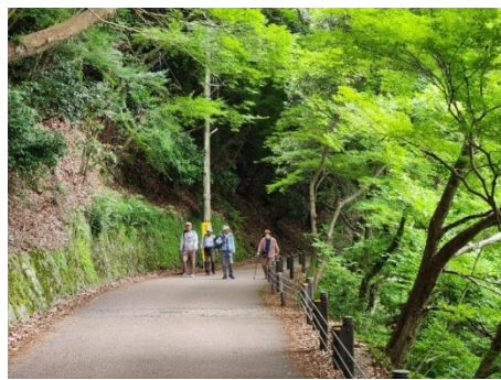
天ヶ瀬吊橋を渡り、緩やかな琴坂を登り興聖寺へ