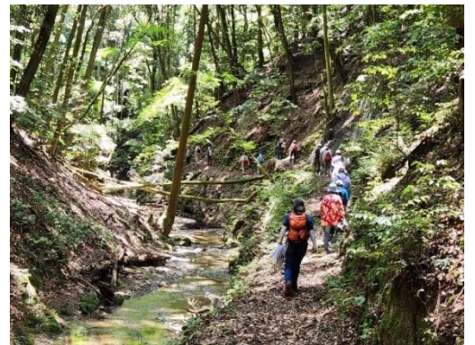
谷川のせせらぎ、サクサク落葉、蒼い紅葉のトンネル、細い山道、木漏れ日・・・何もかもが心地いい