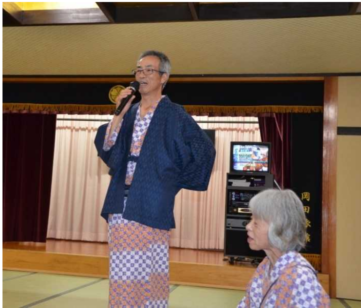
台風の心配、参加人数の心配、予算の心配、道路は通れるか、あれやこれや幹事さんも大変でしたね。