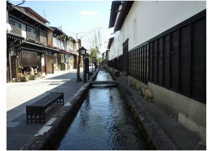
大きな鯉の泳ぐ静かで歴史ある町並みを散策