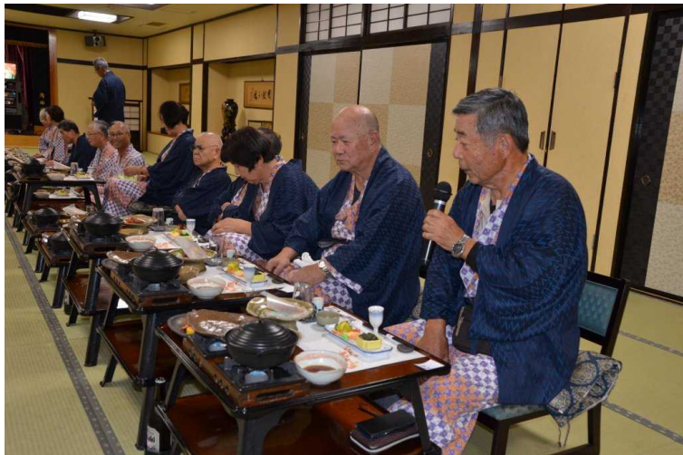
大宴会の始まり！始まり！ まずは会長のご挨拶から・・・