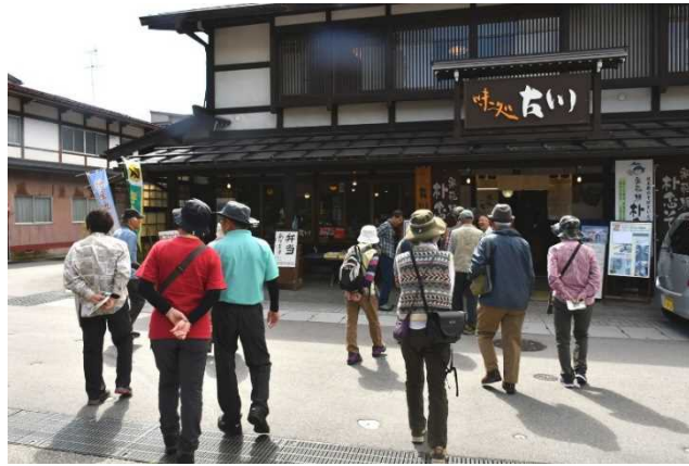
「味処古川」唐辛子味噌がおいしくて買う人も。