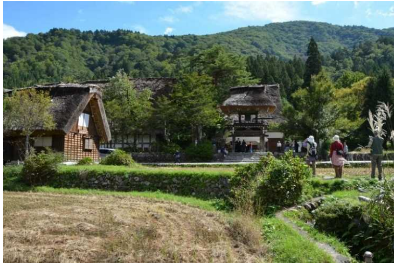
「いろり」で蕎麦定食を

正面に見えるのは珍しい茅葺き屋根の「明善寺鐘樓門」この日は何かの催しのように明善寺は見学できませんでした。