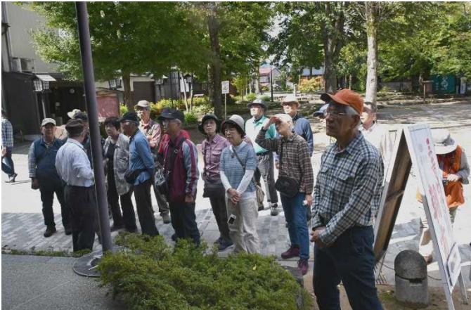
親切な店主から古川の匠の話聞く。

前日、超大型台風 24 号の襲来で旅行が危ぶまれたが、夜の内に足早に通り過ぎ、まさしく台風一過の好天になった。早い集合時間にもかかわらず全員定刻前に集合、7:30 出発する。順調に進み飛騨古川に到着。