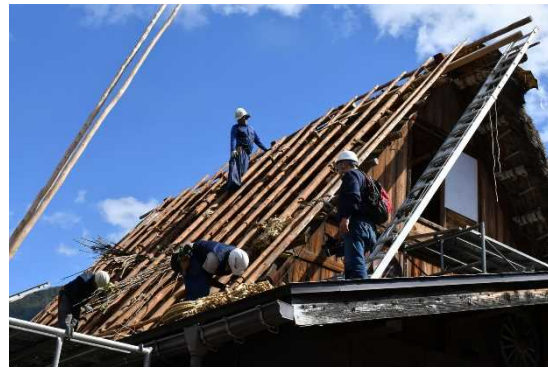
茅葺き屋根の葺き替え中