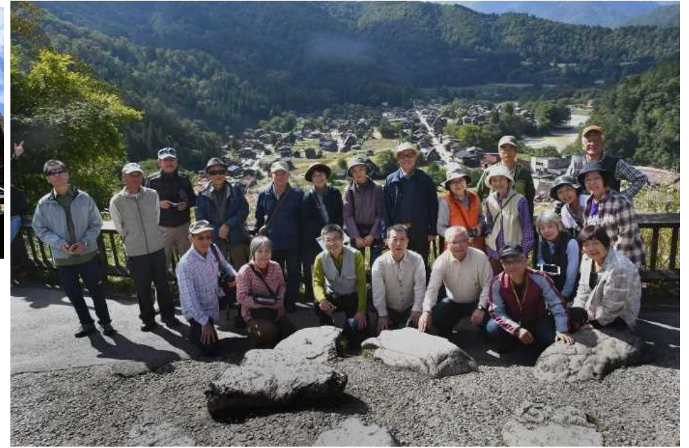
展望台から見る景色は最高！ 稲刈りはもう終わっていました。

正面に見えるのは珍しい茅葺き屋根の「明善寺鐘樓門」この日は何かの催しのように明善寺は見学できませんでした。