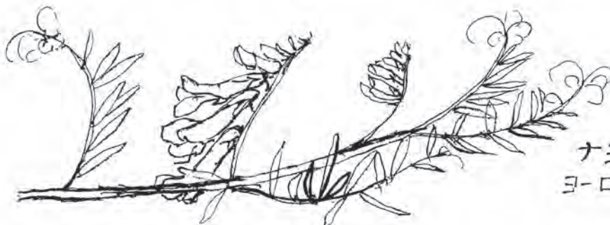
ナヨクサフジ ヨーロッパ原産 1~2年草