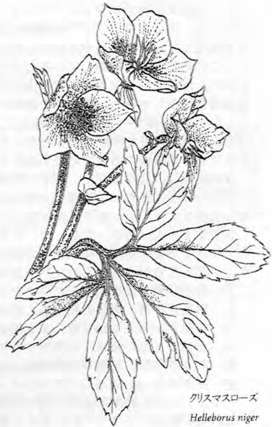
クリスマスローズ Helleborus niger

花期は、12月から3~4月まで咲くようですが、12月のクリスマス時期に咲く、バラに似た花から、この名前がついたようです。寒さに強く、雪を持ち上げて花を咲かせることから別名「雪起こし」とも呼ばれています。