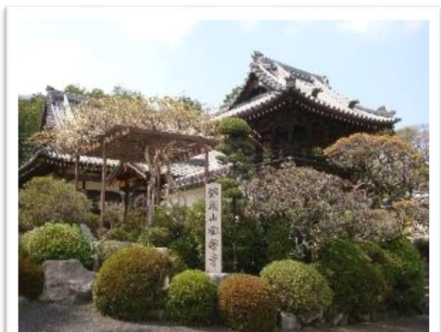
葛城氏館跡のそばに立つ極楽寺鐘楼門

御所市付近は、天孫降臨の舞台になった史跡高天原や祭祀関係を司った鴨氏を祀る神社の存在などから、古くは神々が集まる神聖な場所として敬われていました。古墳時代以降、葛城氏が勢力を伸ばし、特に葛城襲津彦（かつらぎそつひこ）の時代に大王家と姻戚関係を結ぶとともに朝鮮半島に出兵するなど軍事面でも活躍をし、一躍大和政権内で有力豪族になりました。今回は、葛城氏ゆかりの場所をめぐる。