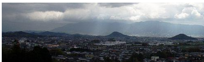
大美和の杜展望台より大和三山