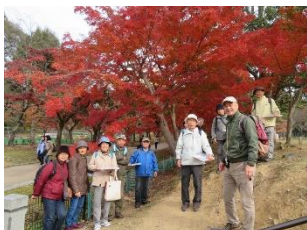
【イロハモミジの紅葉】

昨年は、思いがけず目にした見事な百日紅(サルズベリ)の紅葉に感動しました。今回はどんな自然との出会いがあるか、ご自身の目でお確かめください。たくさんの皆さまのご参加、心よりお待ちしております。