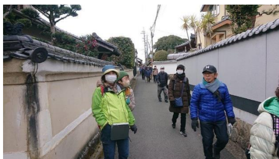
西里の町並み 古墳は江戸時代末までこの地域の人々によって守られており、副葬品が未盗掘であった。二人の被葬者は誰？