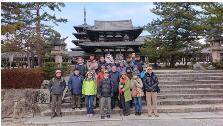
昼食後、法隆寺の前で集合写真 おお～～寒・・・