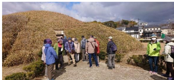
住宅地の中にきれいに整備された藤ノ木古墳を訪ねる

行 程：法隆寺駅—藤ノ木古墳—西里の町並み—昼(芳庵)—法隆寺涅槃会(西院伽藍)—大宝蔵院—東院伽藍(夢殿)—JR法隆寺駅 16時頃解散行程約6k