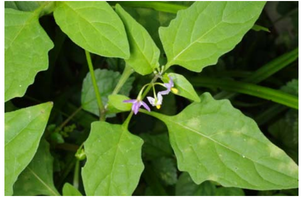
アメリカイヌホオズキ (アメリカ犬酸漿)

イヌホオズキに類似するが、葉は幅が狭く、周りは凹凸がある。花柄の一点から 2~5 個の紫色または白色の花をつける。花期は 7~9 月。