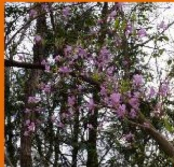
49 コバノミツバツツジ